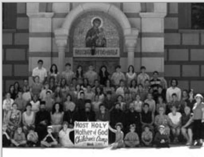
Jedna od grupa dece iz kampa sa upravom

"Deca su i pažljiva i radoznala, u zavisnosti od toga u kom su uzrastu i koliko im govorimo. Mlađi imaju mnogo pitanja, to su iskrena pitanja, starija deca malo manje pričaju, ali mi se trudimo da nađemo način da im se približimo. Mi predajemo veronauku, srpski jezik i muziku, i ja primetim da