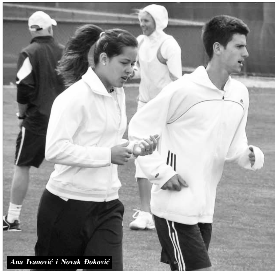
Ana Ivanović i Novak Đoković