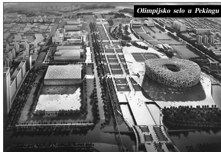
Olimpijsko selo u Pekingu