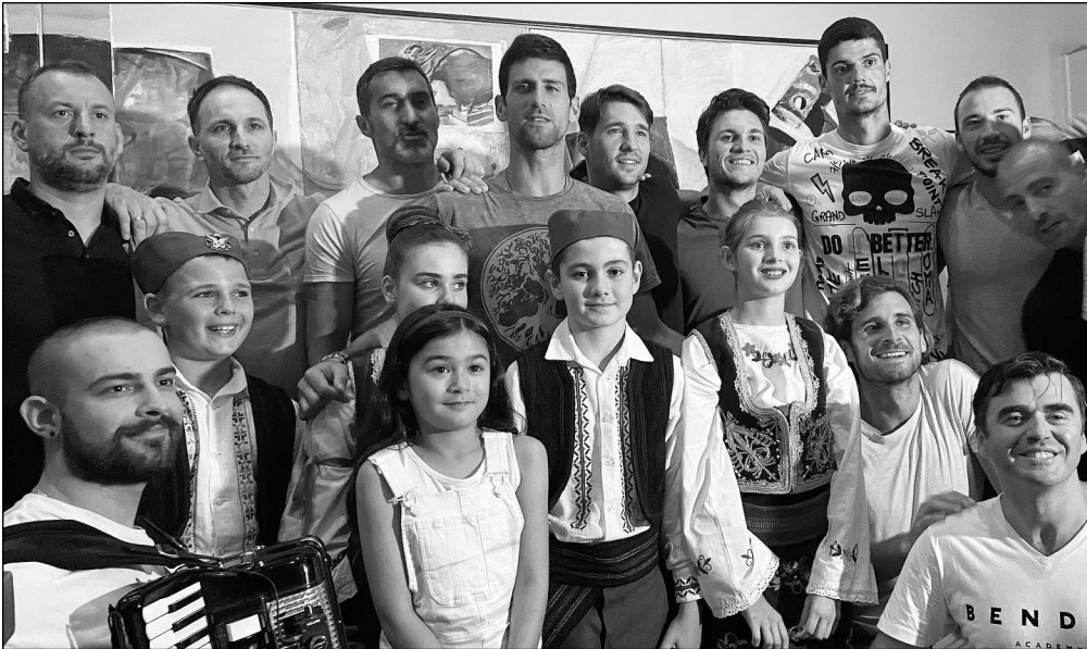
Srpska dijaspora širom planete proslavila Božić, Srpsku novu godinu i pobedu naših tenisera