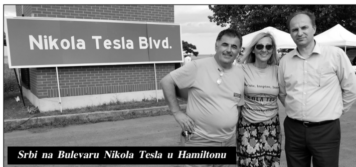
Srbi na Bulevaru Nikola Tesla u Hamiltonu

U planu je da ime Nikole Tesle ponese još jedna škola u Južnom Ontariju, zatim Teslin tehnički muzej u Kalgariju i tri ulice u Otavi, Kalgariju i Vankuveru.