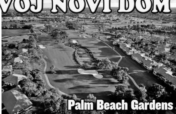
Palm Beach Gardens