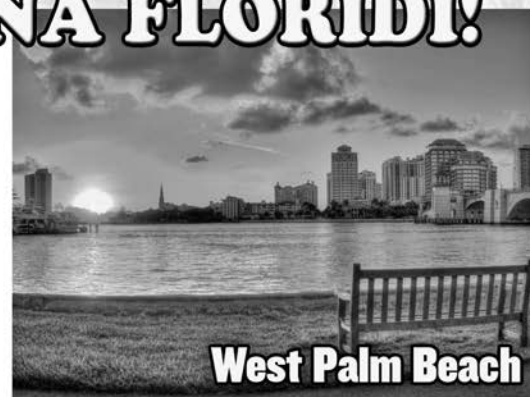
West Palm Beach