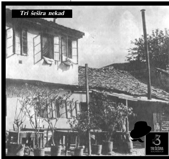
Tri šešira nekad

održane prve predstave beogradske opere. Posle gašenja opere, na istom mestu otvoren je bioskop koji se od 1928. godine zove "Balkan". Dolazili su ljudi različitog obrazovanja, različitih zanimanja kojima je osnovna kategorija bila kafana.