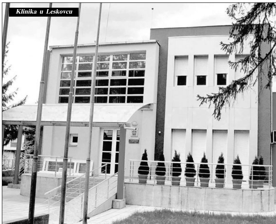
Klinika u Leskovcu