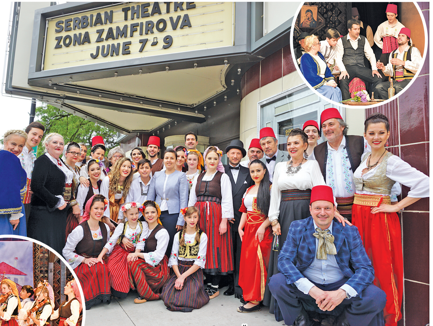
OVACIJE NA PREMIJERI POZORIŠNE PREDSTAVE "ZONA ZAMFIROVA"

OD ATLANTIKA DO PACIFIKA INDEPENDENT SERBIAN NEWSPAPER IN THE USA НЕЗАВИСНИ МЕСЕЧНИ ЛИСТ СРБА У САД