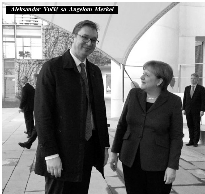
Aleksandar Vučić sa Angelom Merkel

FT dodaje, pozivajući se na navode analitičara, da su Merkel i Makron bili domaćini samita zbog zabrinutosti razvojem događaja u regionu, uprkos, kako ocenjuje, uspehu bez presedana u vezi sa postignutim sporazumom o imenu Severne Makedonije. EU, zaključuje FT, već dugo govori o mogućnosti ulaska zemlja Zapadnog Balkana u taj blok kako bi podstakla ekonomski napredak i poboljšala širu regionalnu stabilnost, prenosi Tanjug.