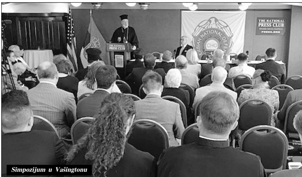
Simpozijum u Vašingtonu

Na proslavi su govorili članovi američkog Kongresa, senator Ron Džonson i kongres-