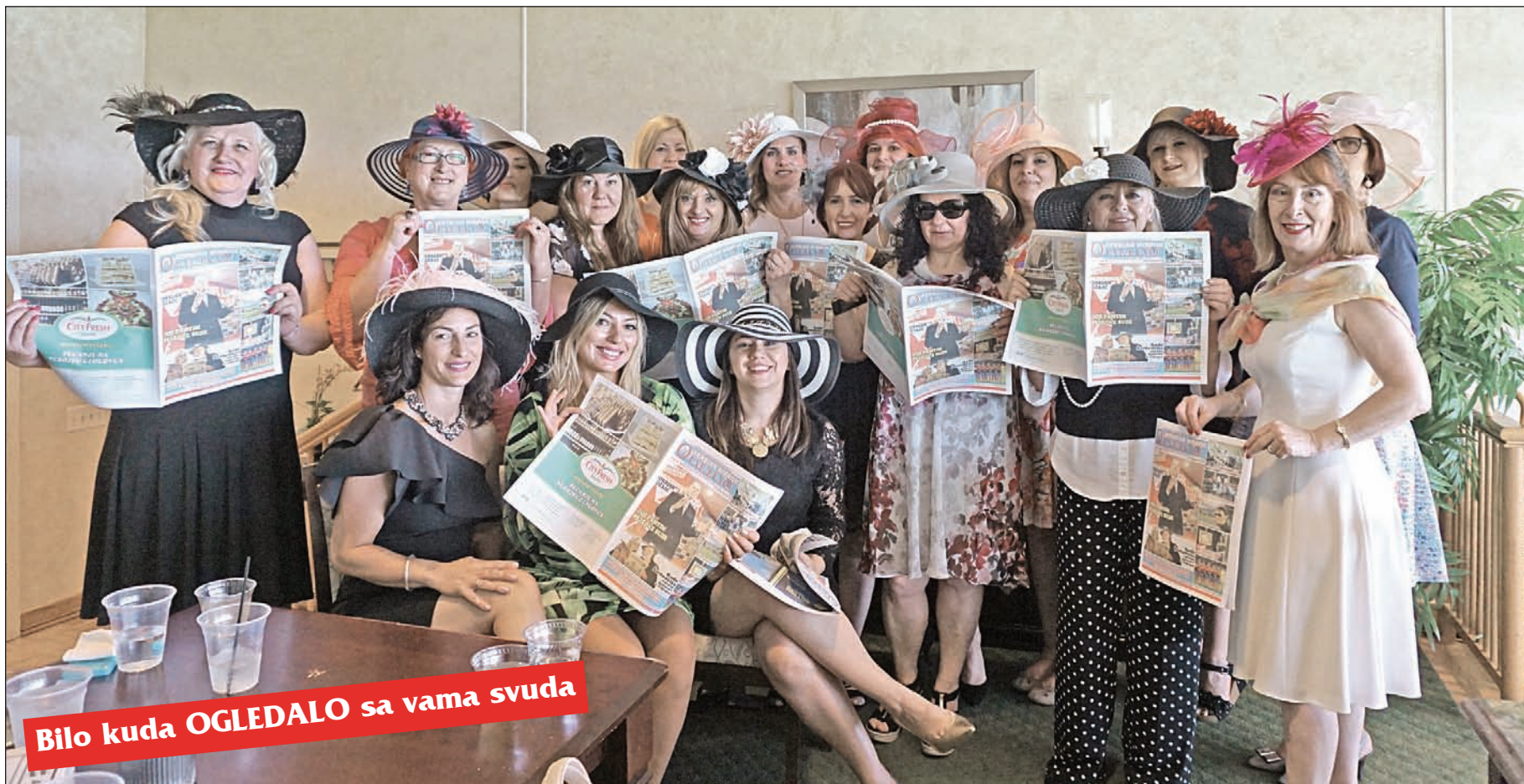
Bilo kuda OGLEDALO sa vama svuda