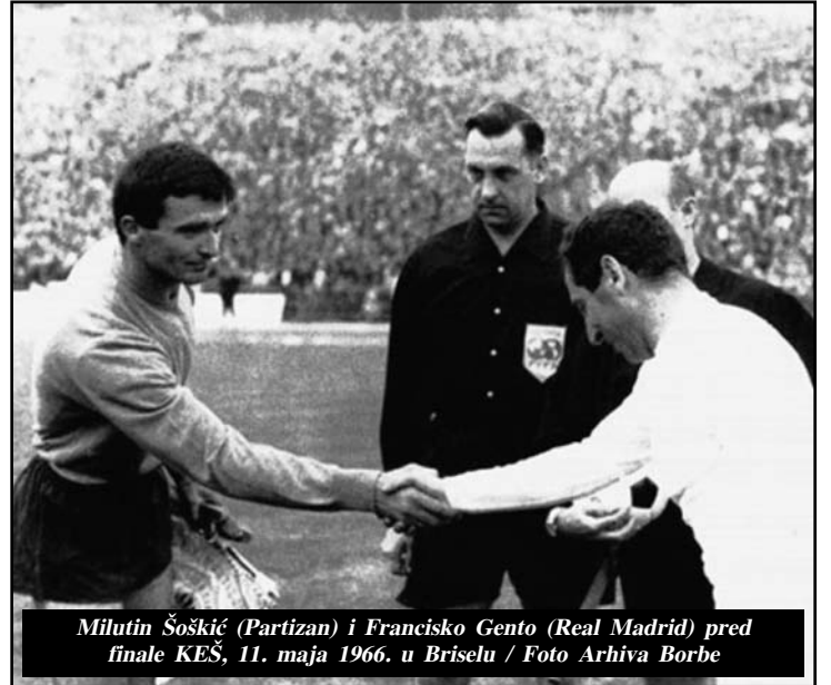
Milutin Šoškić (Partizan) i Francisko Gento (Real Madrid) pred finale KEŠ, 11. maja 1966. u Briselu

i vratiti u Ameriku, zapravo, umirivao sam ih, a znao sam da povratka neće biti. Ubedjivali su me, na sve načine, da ostanem... Onda smo se pozdravili. Ispratili su me. Dugo su stajali, dugo sam stajao. Bio je to težak rastanak.