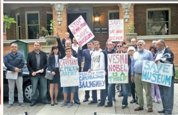
SRPSKI LEGAT - SVETI SAVA