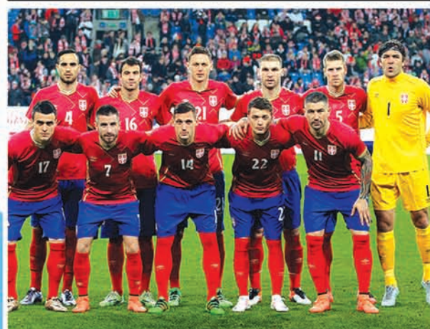
"ORLIĆI", SAD SE POKAŽITE!