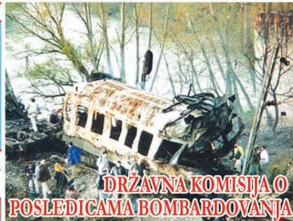
DRŽAVNA KOMISIJA O POSLEDICAMA BOMBARDOVANJA