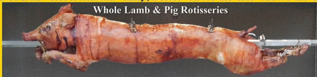
Whole Lamb & Pig Rotisseries

Uni-BBQ. Inc • 5016 W. Foster Ave. • Chicago, IL 60630 • Ph: 773-205-0010 • Fax: 773-205-6660