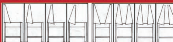
ILLUSTRATION ABOVE SHOWS HOW WE1 & WE2 SHIELDS TILT (4 POSITION) TO CONTROL HEAT DIRECTION