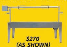
MODEL LCE (22" HIGH)