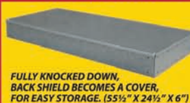
FULLY KNOCKED DOWN, BACK SHIELD BECOMES A COVER, FOR EASY STORAGE. (55 1/2" X 24 1/2" X 6")