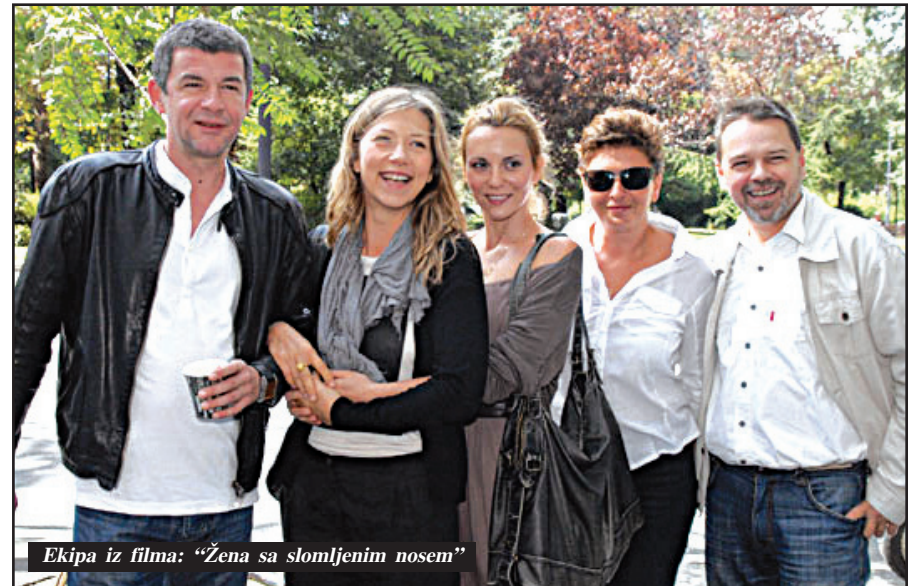
Ekipo iz filma: "Žena sa slomljenim nosom"

glumačkog sazrevanja. Kako se Glogovac umetnički nadograđivao?