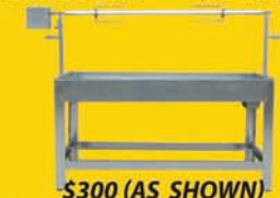
MODEL LAE (28" HIGH)