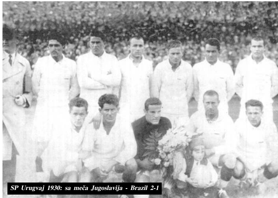
SP Urugvaj 1930: sa meča Jugoslavija - Brazil 2-1

Posle toga, osim petog mesta u Italiji '90. sva ostala naša učešća svodila su se na kalkulacije i računice – kako primiti gol manje, kako se ne povrediti, zaraditi,