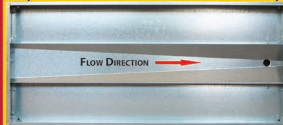
Top view of the inside of roasters 55" L x 24" W x 5.5" Deep

Our unique patented design (US PATENT NO. 8,770,182) collects dripping liquids to a pitched channel and directs them away from the cooking area into the drain pan where they belong and not on your floor. (The drain pan is located under the roaster)