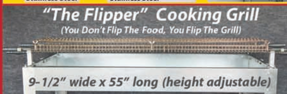
"The Flipper" Cooking Grill (You Don't Flip The Food, You Flip The Grill)

9-1/2" wide x 55" long (height adjustable)