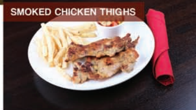
SMOKED CHICKEN THIGHS