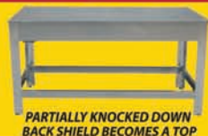
PARTIALLY KNOCKED DOWN BACK SHIELD BECOMES A TOP