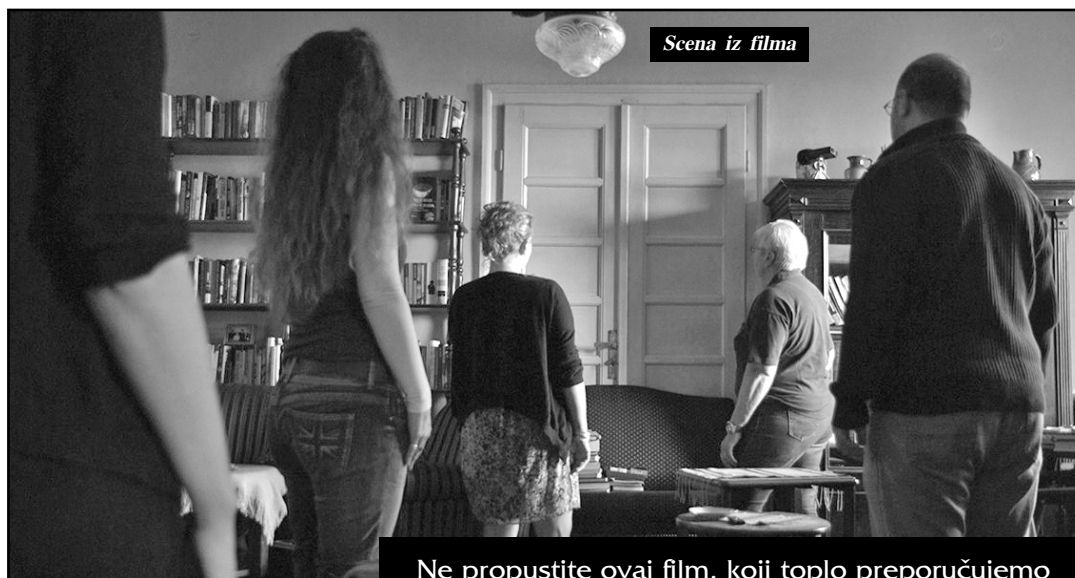
Scena iz filma

- Mi smo obeleženi tim brisanjem, jer čovek bez sećanja ne može imati identitet. Pošto smo mi zemlja koja briše sećanje, stalno se mučimo s identitetom. Nemamo koren u