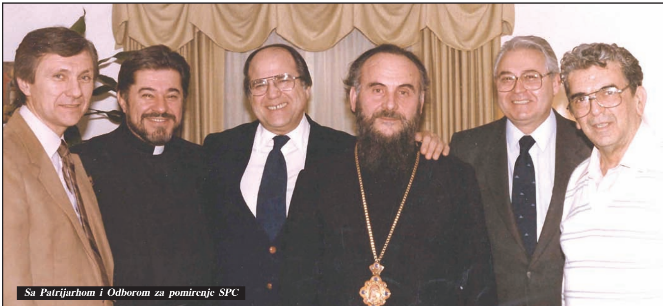
Sa Patrijarhom i Odborom za pomirenje SPC

Posle koncerta u mestu Chambery u Francuskoj, hor je bio u Parizu. Kada je