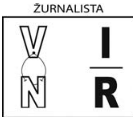
Rešenje: NOVINAR ( N o V, I na R)