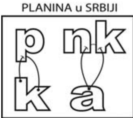
Rešenje: KOPANIK (K o P, A o N i K)