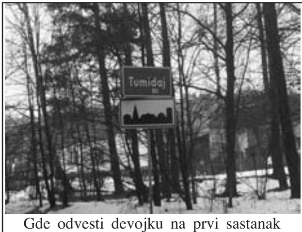
Gde odvesti devojkju na prvi sastanak

2 prelomna momenta u životu muškarca : -PRVI PUT kad shvati da NE MOŽE DRUGI PUT ! - DRUGI PUT kad shvati DA NE MOŽE NI PRVI PUT !