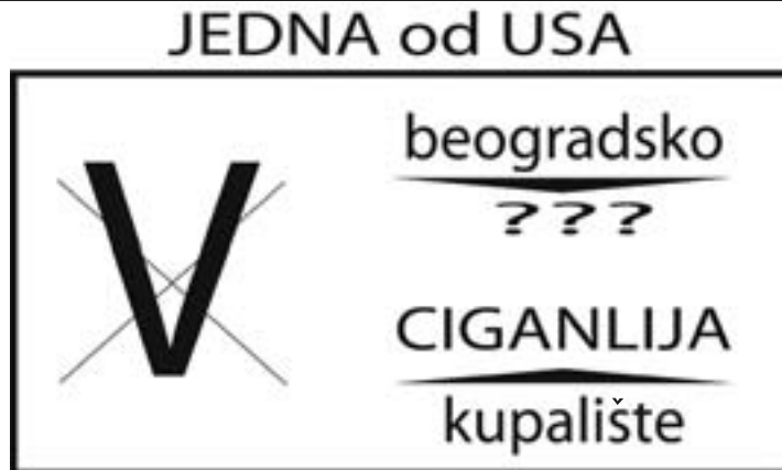
Rešenje: NEVADA ( Ne V, ada)