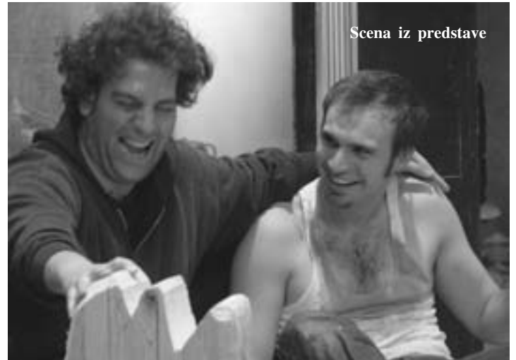
Scena iz predstave

Predstava "Huddersfield" igra se na sceni "Victory Gardens Theater Upstairs Studio" na 2257 N. Lincoln u Čikagu, do 8. jula - četvrtkom, petkom i subotom u 8h uveče, a nedeljom u 3h popodne.