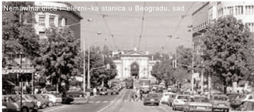
Nemansina ulica i železnička stanica u Beogradu, sada

Pošto je zemljište za zidanje stanice bilo u rupi, podvodno i nevarno, moralo se nasipati. Zato je od stanice Sewak pa do Vajfertove pive na Topčiderskom