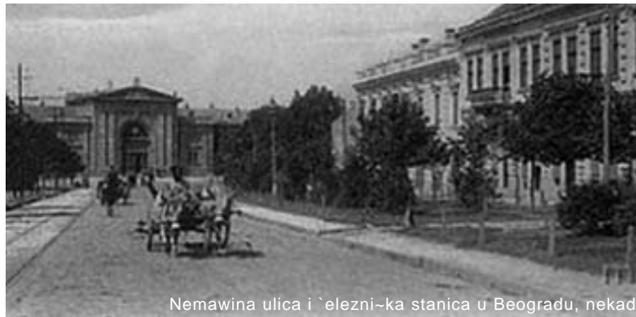
Nemansina ulica i železnička stanica u Beogradu, nekada

Sime Milutinovića-Sarajlije i Marije Punktorke. On je kao inženjer učestvovao u prvom trasiranju naše železnice, a kao arhitekt projektovao je više železnih stanica prvog reda na pruži Beograd-Aleksinac. Zgrada je sagrađena 1884. godine i bila je slična mnogim drugim građevinama ove vrste, koje su se tada podizale širom Evrope