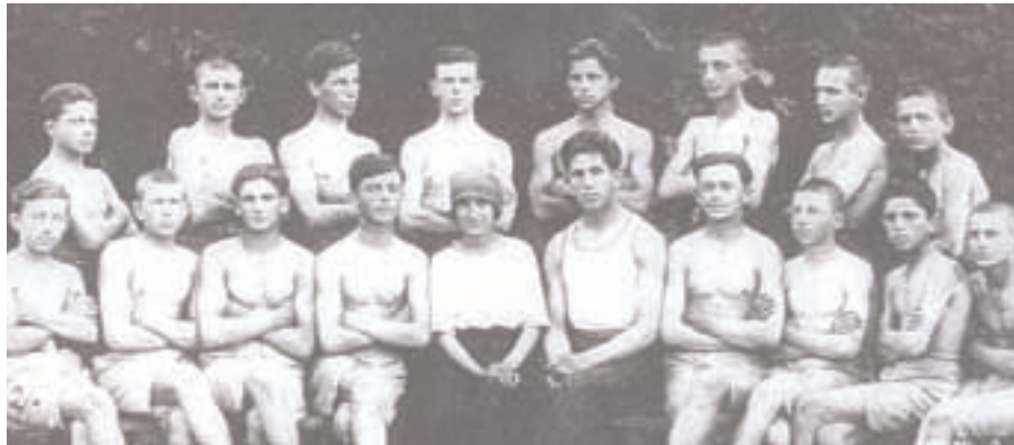
Соколско друштво, Јагодина, 1925. године

Поенкаревој улици. Тада су у Београду биле четири мушке и две женске гимназије. Наша Друга мушка гимназија била је елитна и врло строга школа.