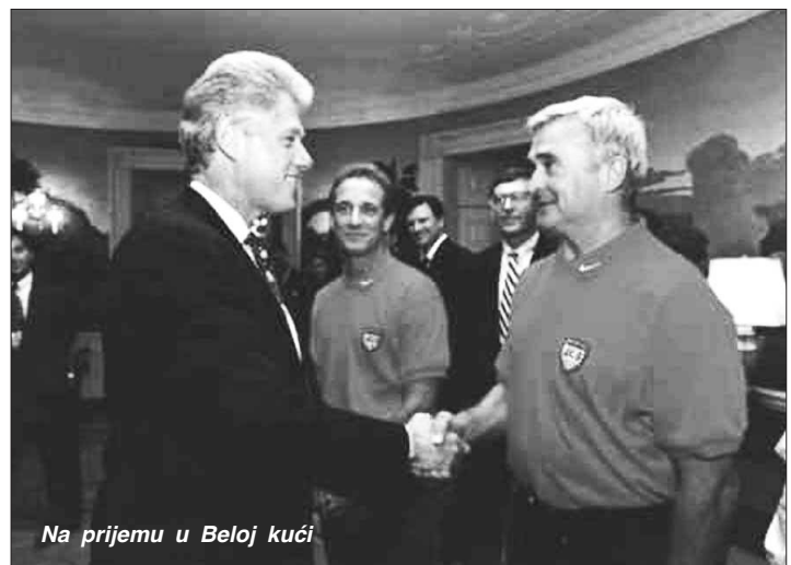
Na prijemu u Beloj kući

- Zamlio sam svoju suprugu da ispeče srpski pogaču sa krstom i na njoj napiše napred USA. Podigao sam pogaču i držao je