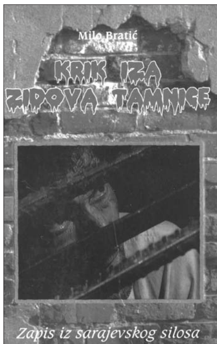
Zapis iz sarajevskog silosa

svetom, nakon kratke i podmukle bolesti, čije razloge možda treba tražiti baš u zidinama "Silosa" (ali koga to danas u ovim globalnim i megaglobalnim "gibanjima" uopšte zanima), na veliku žalost i neprebol njegovih najbližih: majke Bosiljke, supruge Vesne i sinova Siniše i Saše, te njegovih sapatnika iz "Silosa", kao i nas drugih koji smo imali čast da se s njim sretnemo i upoznamo ga na ovim najzapadnijim stranama našeg jedinog sara. Njegovim najbližim za utehu da miljenici Bogova uvek umiru mladi, kako